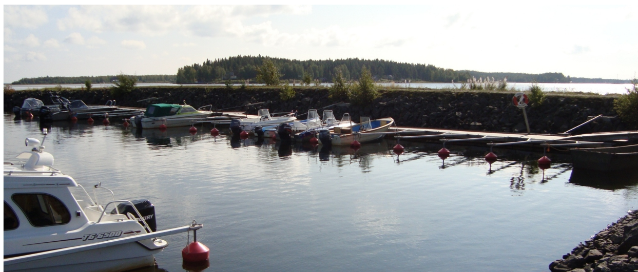
Bild 5: Befintlig flytbrygga vid södra piren, förankrad med stålarmar.